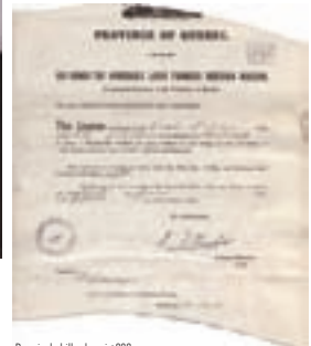
Permis de billard, mai 1888.