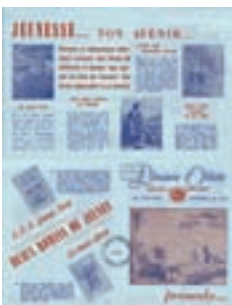
Dépliant publicitaire de la librairie oblate, page 1.