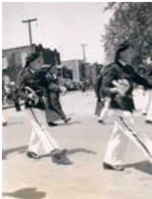
Fanfare, Saint-Pierre Apôtre.