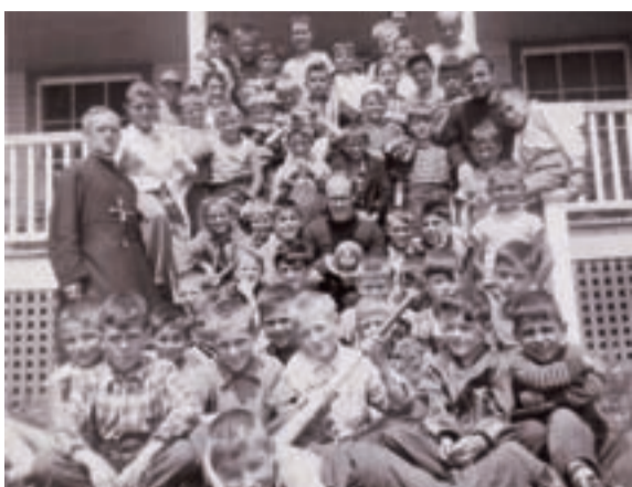
Camp de la paroisse à l'île Perrot - Archives Oblats, 1028-ENV16

L'implication oblate dans le Faubourg à m'lasse ne se limite pas aux domaines des services sociaux, de l'éducation et du développement spirituel. Bien au contraire, les Oblats s'illustrent par leurs initiatives en loisir et en culture. Depuis leur arrivée, ils organisent soirées, tombolas, pique-niques et bazars afin de divertir leurs paroissiens et d'amasser des fonds pour leurs œuvres. S'ajoutent à cela d'autres activités qu'ils mettent sur pied afin d'animer la vie de quartier: billard, quilles, cinéma, séjour à la campagne au chalet acquis pour la paroisse à l'île Perrot et même des cours de violon!