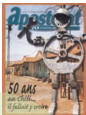
Apostolat International, vol. 69, n° 6, novembre/décembre 1998

Outre les loisirs, les artisans de l'Îlot Saint-Pierre s'illustrent dans le domaine de la culture et des communications. Durant plusieurs années, la bibliothèque de la maîtrise offre aux gens du quartier la chance de consulter des centaines d'ouvrages, offrant ainsi un accès à la littérature aux habitants d'un des secteurs les plus modestes de Montréal. En plus de la bibliothèque, les Oblats tiennent boutique durant les années 1950 à la librairie oblate située en face de l'église Saint-Pierre Apôtre sur la rue de la Visitation. Depuis longtemps, les Oblats ont été impliqués dans le monde des médias, de l'édition et des communications. Par exemple, ils publient l'Apostolat et soutiennent Vie Ouvrière (qui devient par la suite Recto-Verso ) traitant des enjeux interpellant la société québécoise.