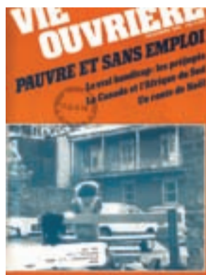
Revue Vie ouvrière, décembre 1985

Outre les loisirs, les artisans de l'Îlot Saint-Pierre s'illustrent dans le domaine de la culture et des communications. Durant plusieurs années, la bibliothèque de la maîtrise offre aux gens du quartier la chance de consulter des centaines d'ouvrages, offrant ainsi un accès à la littérature aux habitants d'un des secteurs les plus modestes de Montréal. En plus de la bibliothèque, les Oblats tiennent boutique durant les années 1950 à la librairie oblate située en face de l'église Saint-Pierre Apôtre sur la rue de la Visitation. Depuis longtemps, les Oblats ont été impliqués dans le monde des médias, de l'édition et des communications. Par exemple, ils publient l'Apostolat et soutiennent Vie Ouvrière (qui devient par la suite Recto-Verso ) traitant des enjeux interpellant la société québécoise.